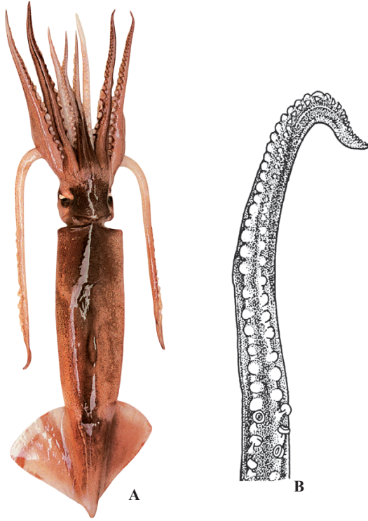
A : 遠洋水産研究所 (アルゼンチン), B : Roper et al. (1984)

FAO 名 (英) : Argentine shortfin squid 別名 : アルゼンチンイレックス, マツイカ (市場)