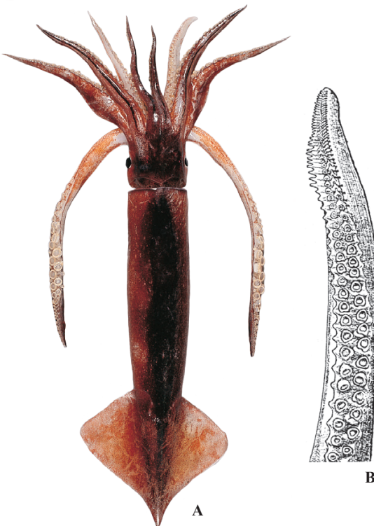
A : 堀川博史 (土佐湾), B : Sasaki (1929)

FAO 名 (英) : Japanese flying squid 市場名 : マイカ, マツイカ, ムギイカ, トンキユウ, ガンゼキ (地方名)