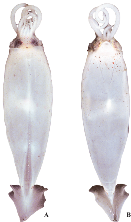
A, B : 久保田正 (駿河湾)