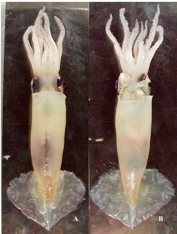
A, B : 酒井光夫

ML 150 mm. 外套膜は細長く、幅は長さの約20%。表面には微細な網目彫刻がある。鰭は菱形。頭部背面には頸軟骨から第I腕基部にかけて走るV字肉畝がある。腕は短く、保護膜は背側で低く、腹側では良く発達する。腕には泳膜の代わりに溝を持つ。腕式はII>III>IV>I。雌の吸盤角質環は平滑、雄では低く弱い歯がある。触腕は短かいが掌部は長く(外套長の33%)、吸盤の分化は不分明。掌部中央は約10列の小吸盤が疎らに並ぶ。先端部には小吸盤が環状に配列する。眼の背円周には薄い発光組織がある。軟甲の終円錐は発達する。南極海~亜南極海。