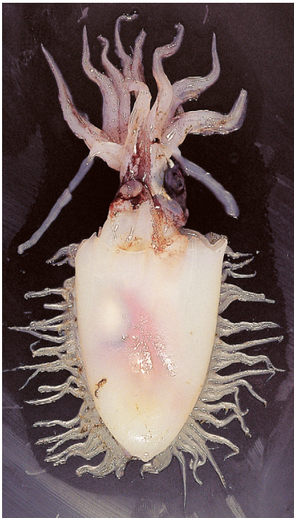
A : 窪寺恒己 (東北)