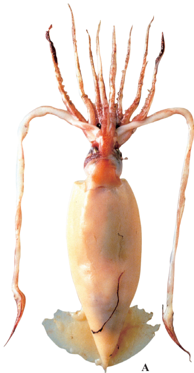
A : 窪寺恒己(南極海), B : Roper et al. (1969)