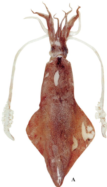
A: 遠洋水産研究所(アンゴラ)

東大西洋・地中海 East Atlantic & Mediterranean Sea