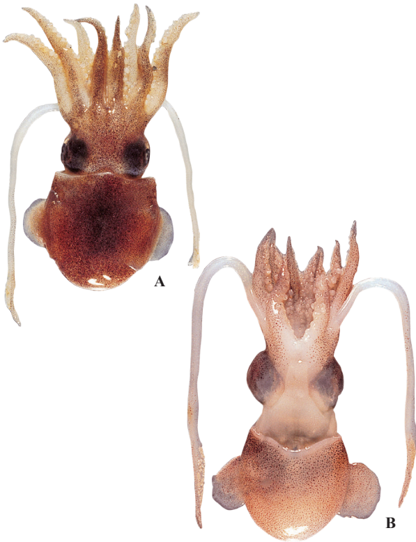
A, B: 藤倉克則 (グリーンランド)