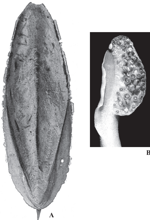
A, B : Lu (1998)